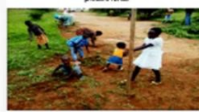
Mobilisation de la communauté (femmes, jeunes, enfants) pour une école propre (débarras, nettoyage de la cour, des latrines, d'infrastructures et environnement de l'école)