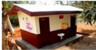
Modèle d'AAA / bloc de 4 latrines - Sâches et auto-ventilés avec renfort, sous-équipés (filles-garçons) et (femmes-femmes)