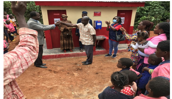
Inauguration of the Bloc of 04 toilets