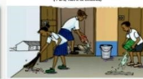
Séances de nettoyage des latrines (WC) par les élèves filles et garçons à l'école