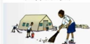
Pas d'ordures dans la cour, ni aux environs de l'école