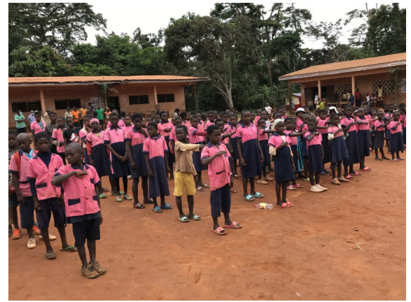
Welcoming AAA and UNAIDS Staff / Performance of the Cameroon National Anthem in the local language by students