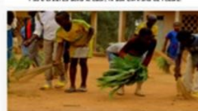
Séances de nettoyage de la cour par les élèves dans une école primaire rurale