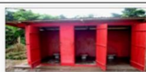
Modèle d'AAA / bloc de 2 toilettes - Sâches et auto-ventilés avec renfort, sous-équipés - Ecole primaire de Dagpa (filles-garçons) et (Enseignants)