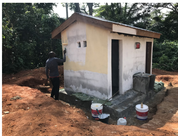
Painting of the toilet