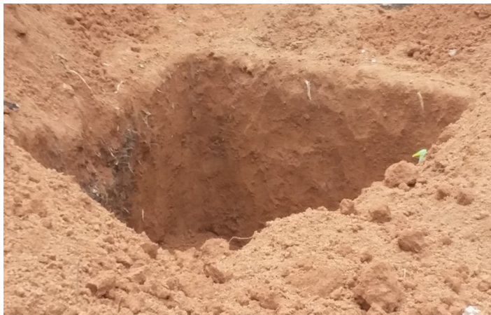
Choice of sight and digging of the toilet pit