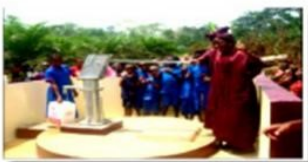
Puits réalisés par AAA à l'école primaire de Ngida - La Présidente de l'Association des Femmes adhérentes à la CEEA et élèves puisant de l'eau en utilisant les bâtons d'AAA