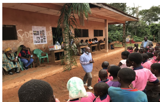
Open air training of students on Education +