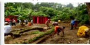
Nettoyage de l'environnement scolaire par les adultes de la communauté - CEEA de Dagpa