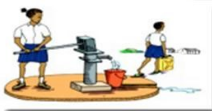
Différentes formes d'approvisionnement en eau potable