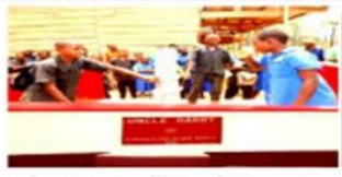
Puits réalisés par AAA ou CES d'Alone - Elites barant de l'eau potable