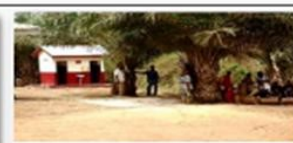
Modèle d'AAA / bloc de 4 toilettes - Sâches et auto-ventilés avec renfort, sous-équipés - Centre Santé d'Alone (filles-garçons) et (femmes-femmes)