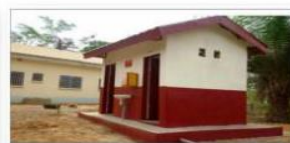
Modèle N° 3 : Bloc de 4 Latrines (WC) sexo - séparées CVECA d'Abem • Filles, Garçons, Femmes, Hommes