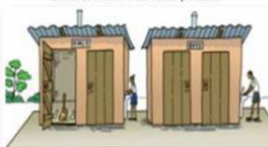
Modèle N° 1 : Latrines (WC) sexo - séparées (filles et garçons) A gauche : une fille lave les mains à la sortie des latrines A droite : un garçon lave les mains à la sortie des latrines