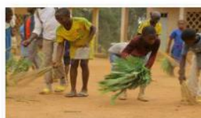
Séance de balayage de la cour par les élèves dans une école publique rurale – CVECA de Ngalla