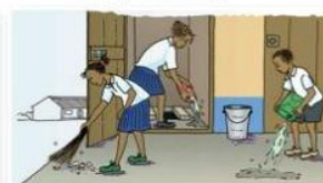
Séances de nettoyage des latrines (WC) par les élèves filles et garçons à l'école.