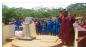
Puits CVECA Ngalla – La Présidente de l'AFAC et enfants puisant de l'eau en utilisant les bidons d'AAA.