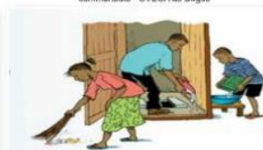
Séances de nettoyage des latrines au sein de la famille (Père, Mère et Fils)