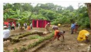
Nettoyage de l'environnement scolaire par les adultes de la communauté - CVECA de Bogso