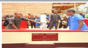
Puits CVECA Abem Enfants buvant de l'eau potable.