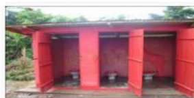
Modèle N° 2 : Bloc de 3 Latrines (WC) sexo - séparées à l'école publique rurale – CVECA Bogso • Filles, Garçons, Enseignants