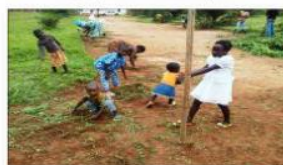
Mobilisation de la communauté (Hommes, femmes, jeunes, enfants) pour une école propre (désherbage, nettoyage de la cour, des latrines, d'infrastructures et environs de l'école)