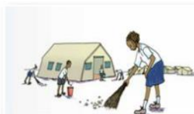
Pas d'ordures, ni dans la cour, ni aux environs de l'école !