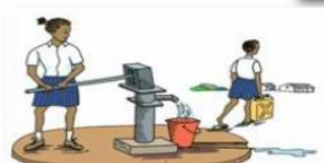
Différentes formes d'approvisionnement en eau potable