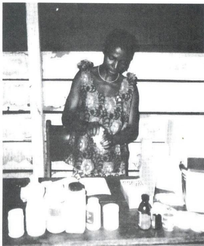
Activités des paysannes

La particularité du GICPAB réside dans son effort d'utiliser la culture du manioc comme un outil pour le développement de sa communauté villageoise. Ailleurs on parle de manger à sa faim et envoyer les enfants à l'école. A Bogso, on dit : "créons une bibliothèque pour le village". La culture du manioc, dit-on encore à Bogso, nourrit le village, mais cela ne suffit pas. Il faut penser à l'avenir.