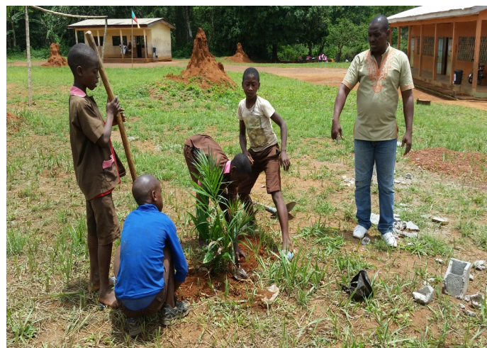
Planting of palm trees