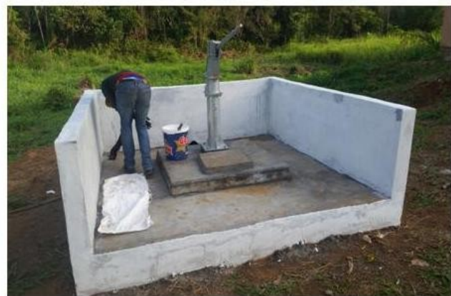
Construction of the well