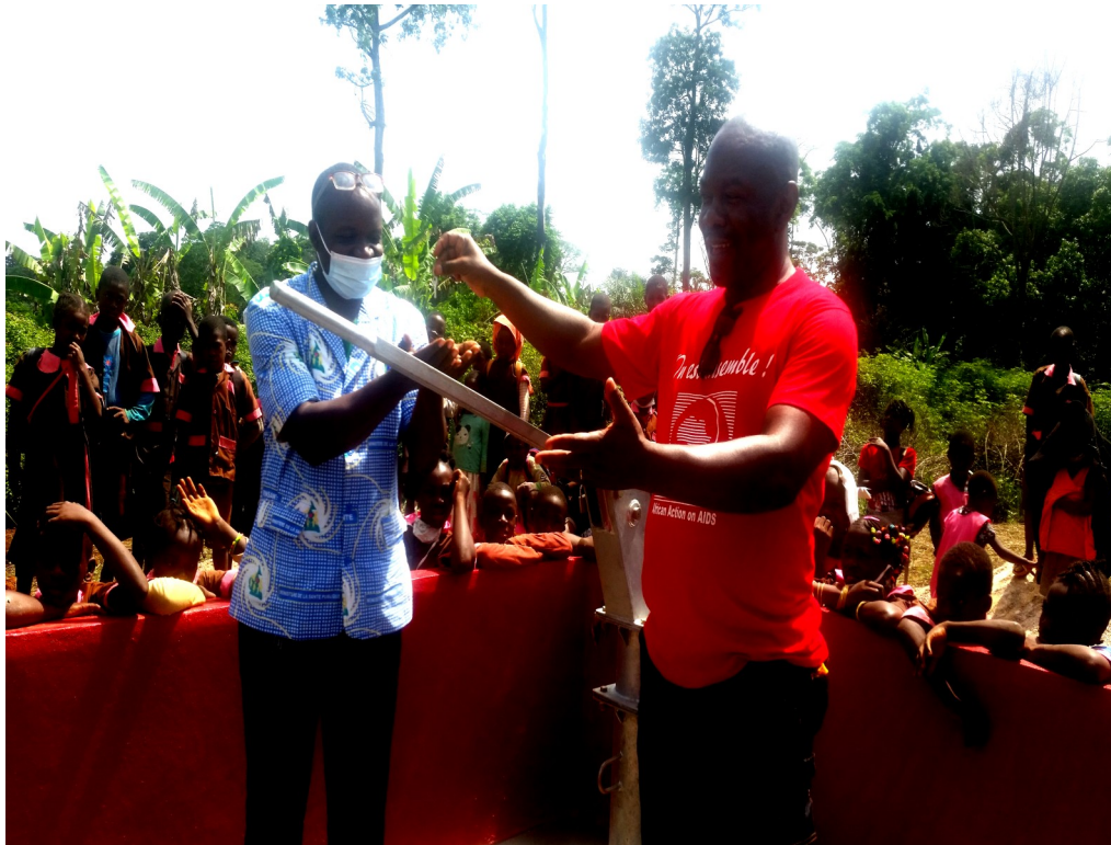
The inauguration of the well by AAA Programmes Officer