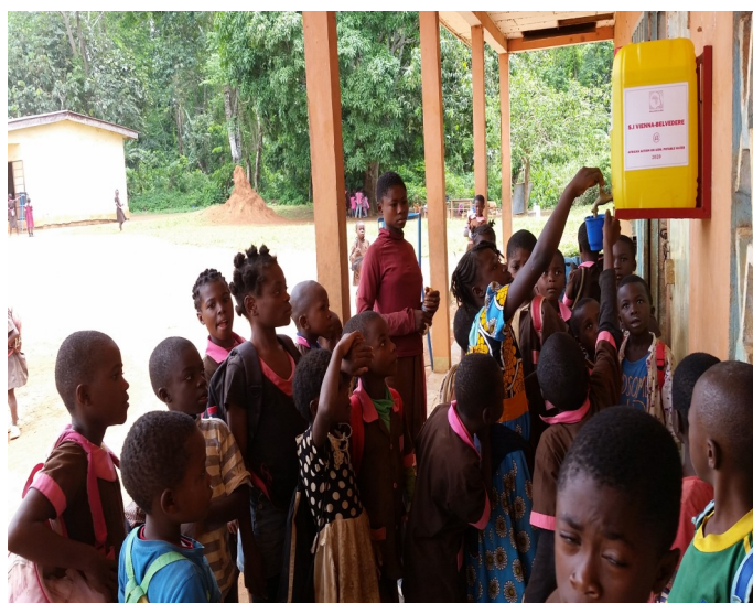
School children using one of AAA's Drinking station.