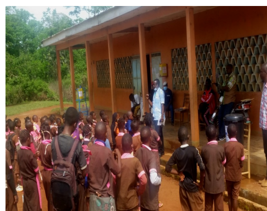
Open air training of students on preventive health strengthening