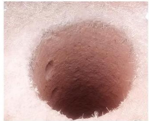
Choice of sight and digging of the well