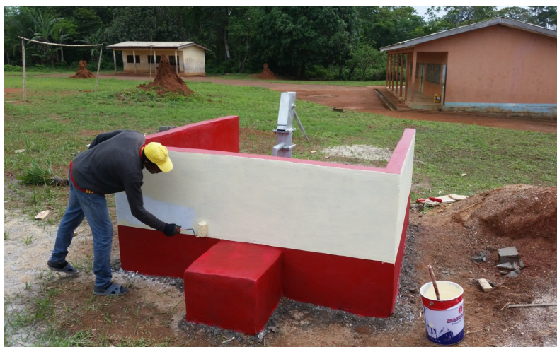
Painting of the well